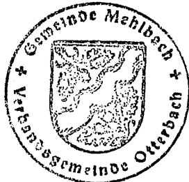
-H a g e r- Ortsbürgermeister