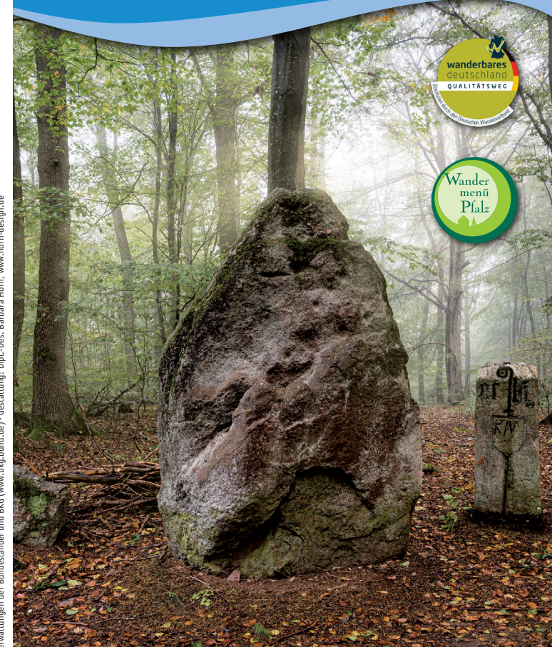
Impressum: Verantwortlich für den Inhalt: VG Otterbach-Otterberg - Kartengrundlagen: outdooractive Kartografie, Deutschland: Geoinformationen © Vermessungsverwaltungen der Bundesländer und BKG (www.bkg.bund.de) - Gestaltung: Dipl.-Des. Barbara Horn, www.horn-design.de

Zwischen Donnersberg und Pfälzerwald auf alten Wegen unterwegs