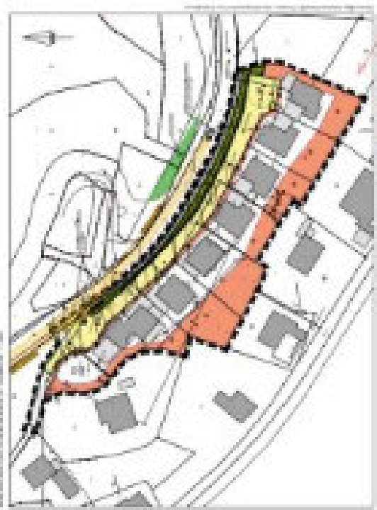
Mapa územní situace objektu