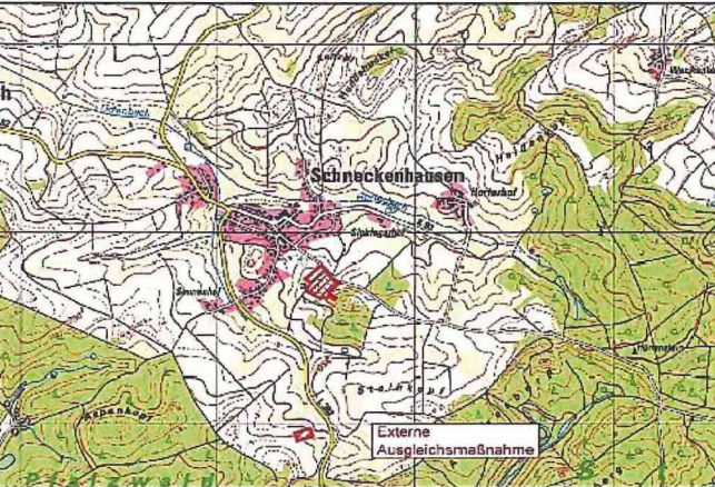
Übersichtslageplan 1:20 000 Plangebiet