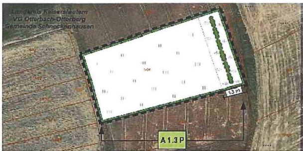
Externe Ausgleichsmaßnahme (M 1:1000)

Maßnahmenbeschreibung A 1.3 P: Ökologische Umgestaltung einer Ackerfläche zu einem Biotoppark aus extensiv genutzten Grünland bzw. Blühstreifen, Anpflanzung einer dreireihigen Gehölzhecke aus gebietsheimischen Strauch- und Baumarten - ggf. Umbruch der Fläche - Entwicklung einer extensiven Wiese durch Ansaat einer gebietsheimischen Saatmischung und anschließender Extensivierung der Nutzung (zweischürige Mahd ab dem 15. Juni und ab dem 15. August) - Etablierung eines 2,3 m breiten Alltagsstreifens entlang der westlichen Parzellengrenze - Anlage eines Blühstreifens durch Ansaat einer blütenreichen und mehrjährigen Saatmischung - Anpflanzung einer dreireihigen Gehölzhecke aus gebietsheimischen Straucher- und Baumarten